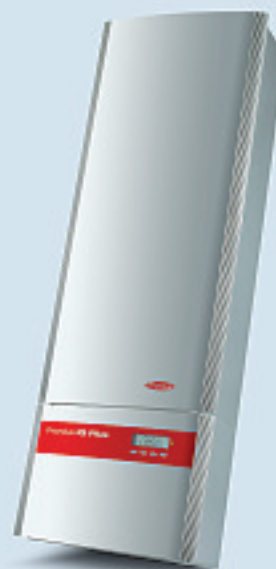
Fronius IG Plus 120 / Fronius IG Plus 150

Der zweiphasige Anschluss sichert eine Phasenschieflast unter 4 kVA. Ausgangsleistung von 6,5 bzw. 8 kW.