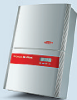
Fronius IG Plus 35 / Fronius IG Plus 50

Stark und kompakt. Die beiden Einphasen-Geräte mit einer Ausgangsleistung von 3,5 bzw. 4 kW für Photovoltaik-Anlagen z.B. bei Einfamilienhäusern.