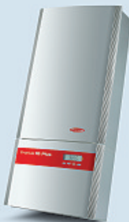
Fronius IG Plus 70 / Fronius IG Plus 100

Stark und kompakt. Die beiden Einphasen-Geräte mit einer Ausgangsleistung von 3,5 bzw. 4 kW für Photovoltaik-Anlagen z.B. bei Einfamilienhäusern.